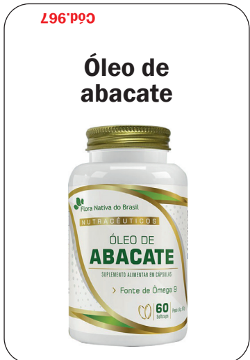
Cód. 967 - 1000mg 60caps