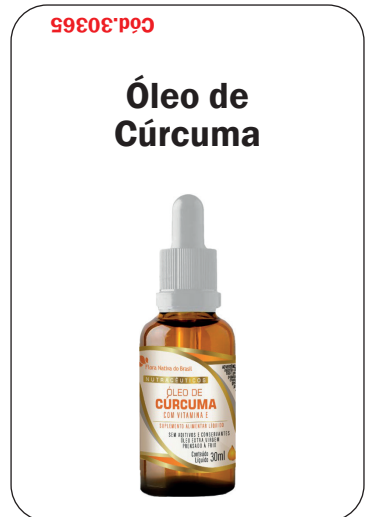
Cód. 30365 - Óleo de Cúrcuma+ Vit.E Gotas 30ml