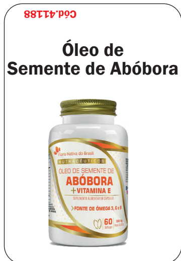
Cód. 41188 - Óleo de Semente Abóbora +Vit. E 1000mg 60caps