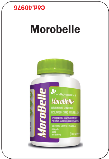
Cód. 40976 - Morobelle 700mg 60caps