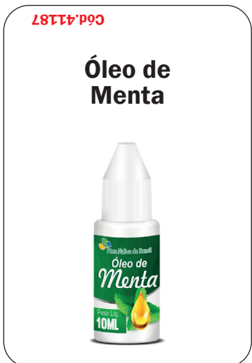
Cód. 41187 - Óleo de Menta 10ml