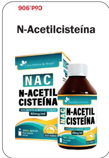
Cód. 906 - 40mg/ml Maracujá 120ml