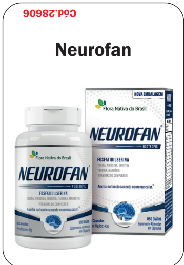
Cód. 28606 - 670mg 60caps