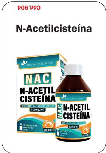
Cód. 904 - 40mg/ml Laranja 120ml