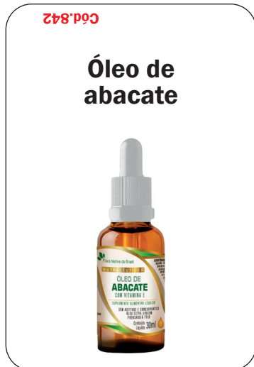
Cód. 842 - Óleo de Abacate + Vit.E Gotas 30ml