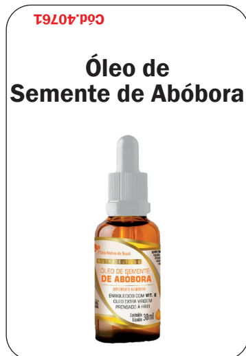
Cód. 40761 - Óleo de Semente Abóbora +Vit. E Gotas 30ml