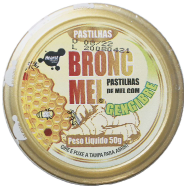
Cód. 789 - Pastilha de Mel/Gengibre 50g