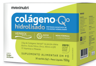
Cód.29572 - Verisol+Q10 L. Siciliano Sachê 30x5g