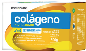
Cód.40988 - Sachê 2X1 Manga/ Maracujá 30X10g