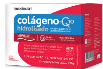
Cód.40990 - Verisol+Q10 F.verm Sachê 30x5g