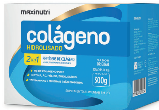
Cód.13064 - Sachê 2X1 Original 30X10g