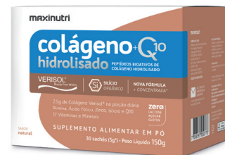
Cód.13080 - Verisol+Q10 Natural Sachê 30x5g