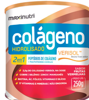
Cód.40993 - Verisol 2X1 F. Vermelhas 250g