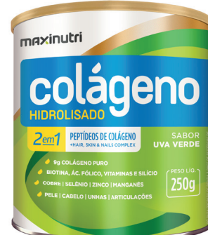
Cód.8109 - 2X1 Uva Verde 250g