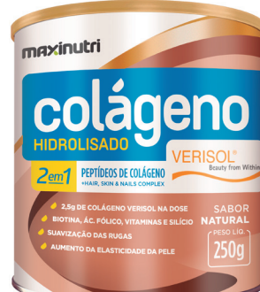
Cód.10316 - Verisol 2X1 Natural 250g