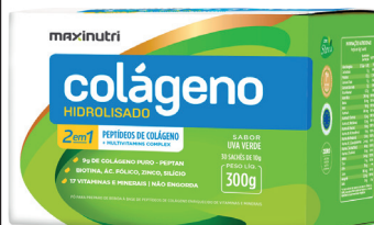
Cód.40989 - Sachê 2X1 Uva Verde 30x10g