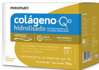
Cód.41247 - Verisol+Q10 Manga/ Maracujá Sachê 30x5g