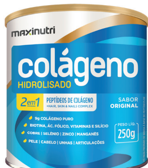
Cód.10162 - 2X1 Original 250g