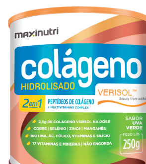
Cód.40994 - Verisol 2X1 Uva Verde 250g